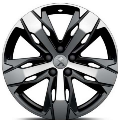
LOS ANGELES 18" Allure Pack /GT