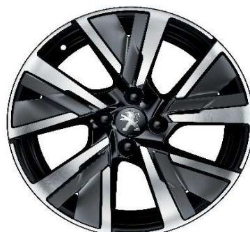
CAMDEN 17" GT