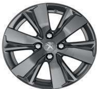
Hydre Gris 16" Active