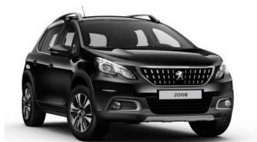
Negro Perla Nera