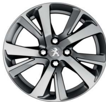
Eridan Anthra Mat 17" Allure y GT-Line